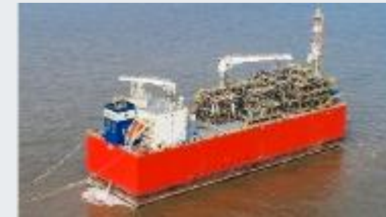
1 FSRU (barge based)