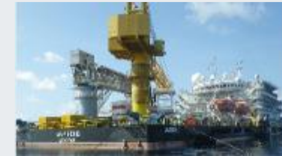
2 accommodatie- platformen