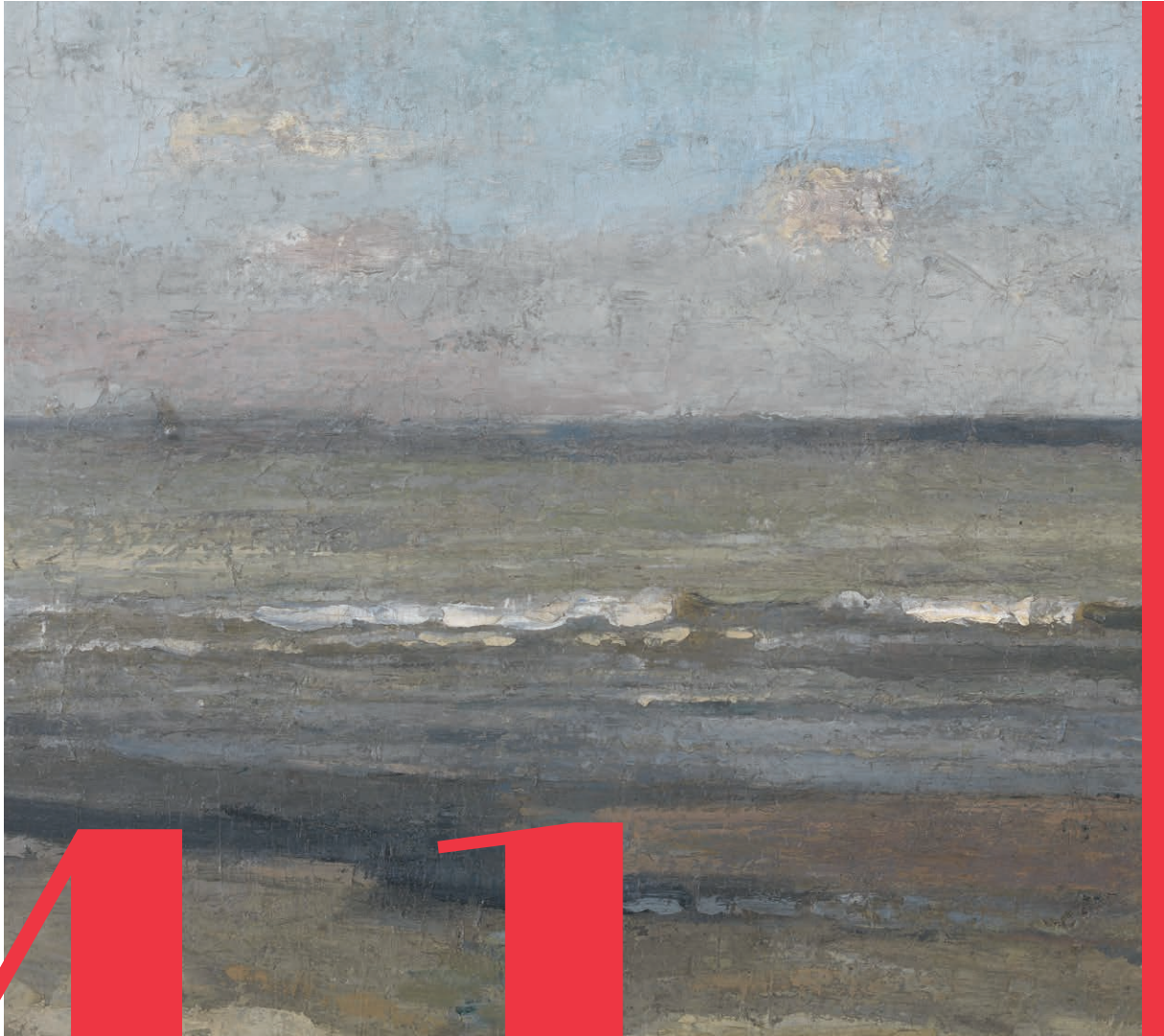
▲ "Grijze zee" KMSKA