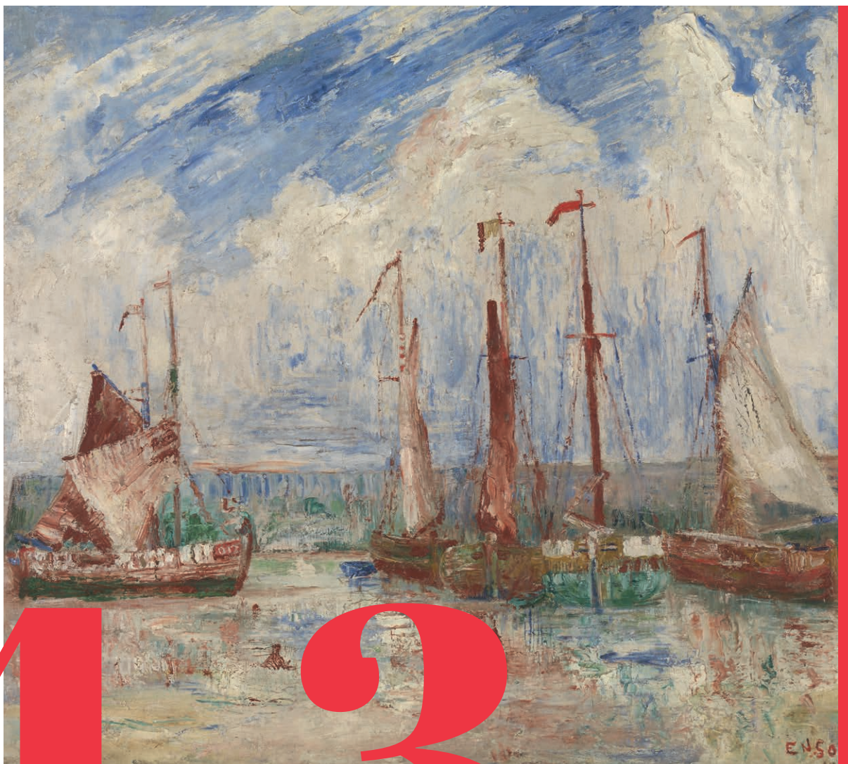
▲ "Sloepen" KMSKA