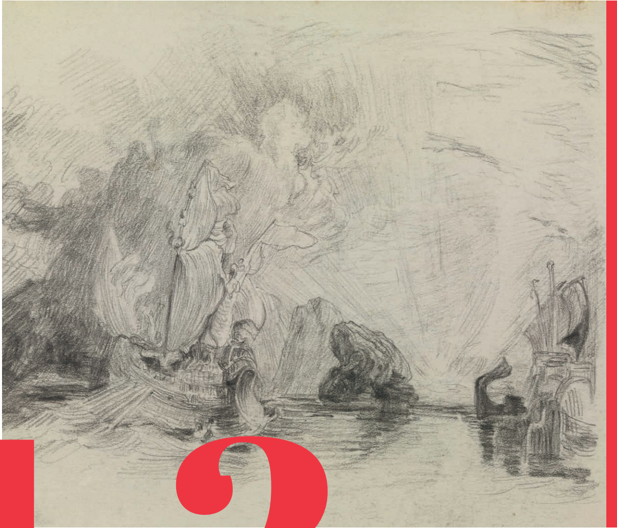
▲ "Odysseus die Polyphemos bespot" KMSKA Fotograaf: Hugo Maertens